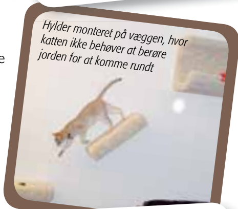
Hylder monteret på væggen, hvor katten ikke behøver at berøre jorden for at komme rundt