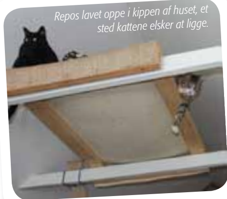
Repos lavet oppe i kippen af huset, et sted kattene elsker at ligge.