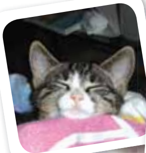
Olsen trænger vist til en sjov leg...